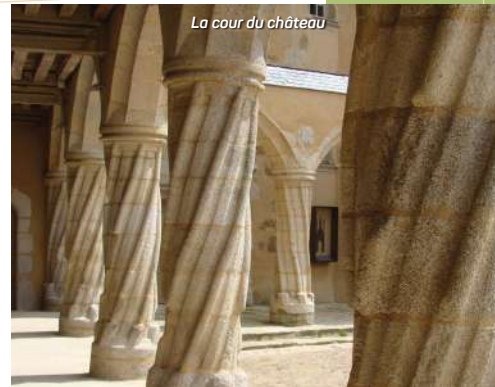
La cour du château

Au XV e siècle, c'est un corps de logis spacieux de style Renaissance qui lui a porté toute son ornementation, ses façades élégantes et harmonieuses. La galerie à arcades et les colonnes torsées de la cour intérieure datent de cette période. L'intérieur est aussi témoin de cet embellissement : deux salles au premier sont décorées de fresques.