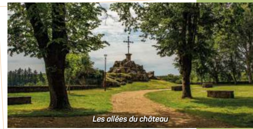
Les allées du château

Plusieurs stations agrémentent ce parcours de 2 kilomètres et permettent d'observer la roche, ou d'identifier la faune et la flore autour de l'étang de Boischenu.