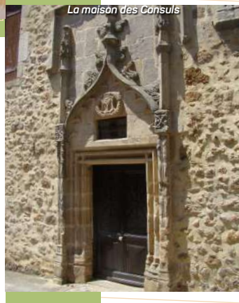
La maison des Consuls

2 La Maison de la Réserve permet de découvrir l'histoire de la météorite de Rochechouart à l'aide de panneaux, maquettes, vidéo... En visitant cet espace récemment rénové, les secrets de ce cratère d'impact unique en France s'offrent à vous !