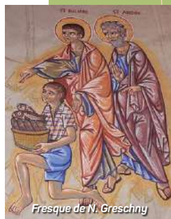
Fresque de N. Greschny

A remarquer : à l'intérieur les peintures murales du XV e siècle et les fresques du chœur réalisées par Nicolai Greschny en 1969.